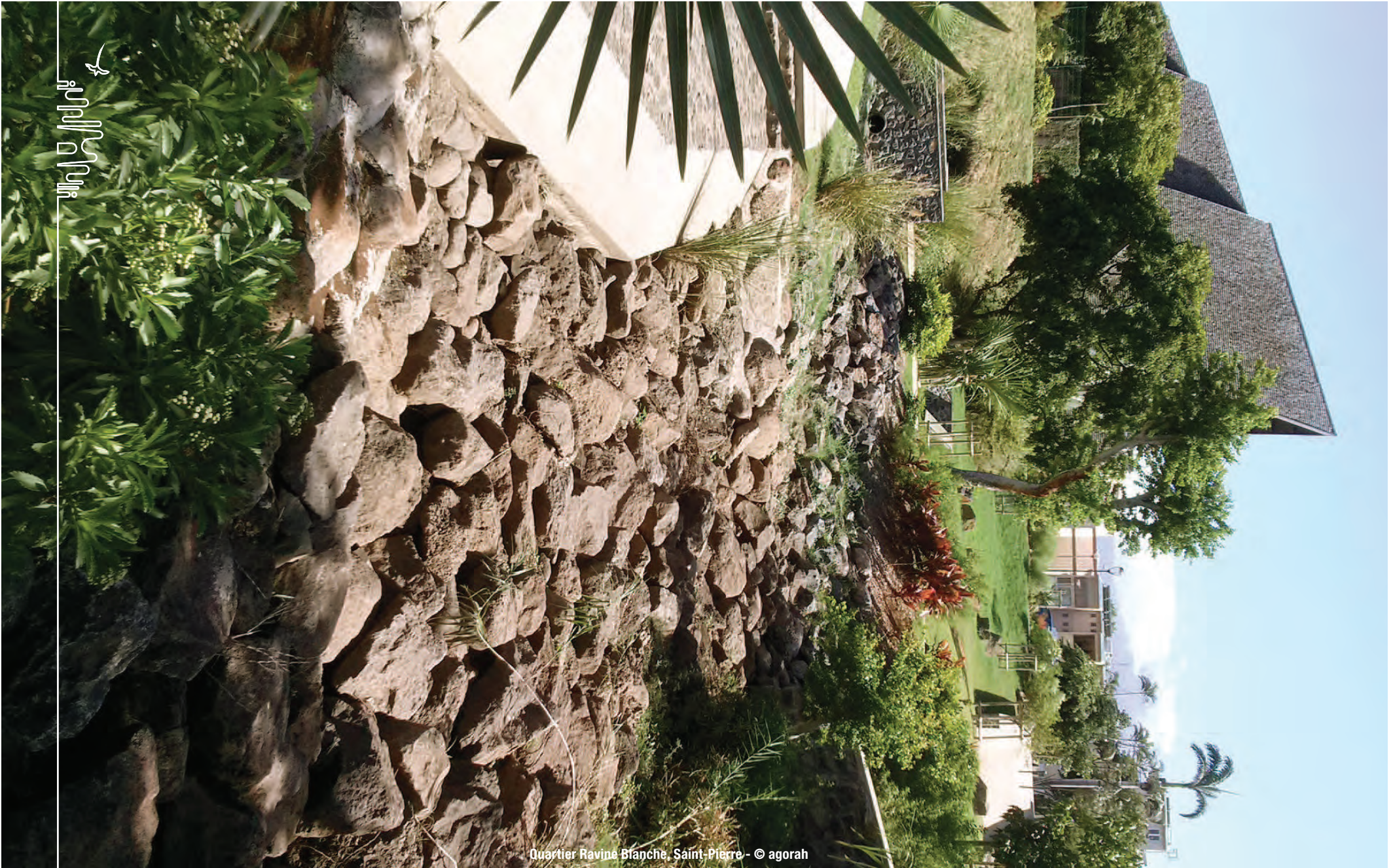
Quartier Ravine Blanche, Saint-Pierre