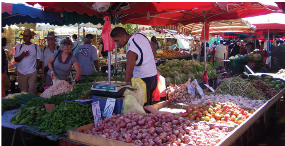
Marché forain

En aval de cet outil de prospective, des organismes publics ou privés proposent la mise en place d'outils opérationnels d'accompagnement de la politique économique du territoire : il est donc important de noter la présence de NEXA - Agence Régionale de Développement, d'Investissement et d'Innovation, société d'économie mixte facilitant l'investissement et renforçant la compétitivité locale (marketing territorial) et en permettant une meilleure ouverture économique du territoire sur le monde (promotion économique).