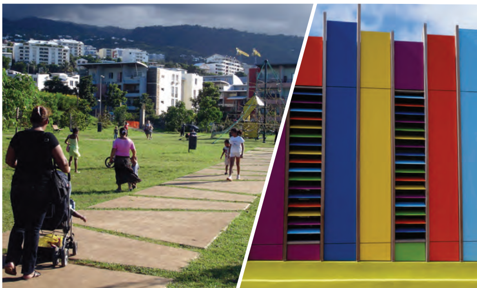
(à gauche) ZAC Trinité, Saint-Denis Ecole maternelle Marie-Curie, Saint-Pierre

■ La généralisation des actions de marketing territorial a également permis de mieux communiquer sur l'attractivité de certaines collectivités, en valorisant auprès de l'extérieur, les qualités intrinsèques au territoire. Cette mise en exergue de potentialités, tout en révélant les qualités architecturales, urbaines, paysagères, et environnementales d'un secteur géographique, a permis de qualifier ce même périmètre aux yeux de ses habitants. L'appropriation locale devient ainsi un facteur de cohésion sociale.