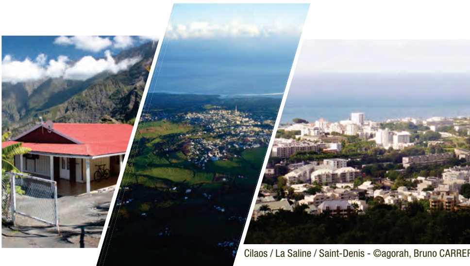
Cilaos / La Saline / Saint-Denis - ©agorah, Bruno CARRER

Le plan local d'urbanisme (PLU) est un document d'urbanisme qui, à l'échelle d'un groupement de communes (EPCI) ou d'une commune, établit un projet global d'urbanisme et d'aménagement et fixe en conséquence les règles générales d'utilisation du sol sur le territoire considéré. Le PLU doit permettre l'émergence d'un projet de territoire partagé prenant en compte à la fois les politiques nationales et territoriales d'aménagement et les spécificités d'un territoire (Art. L.121-1 du code de l'urbanisme).