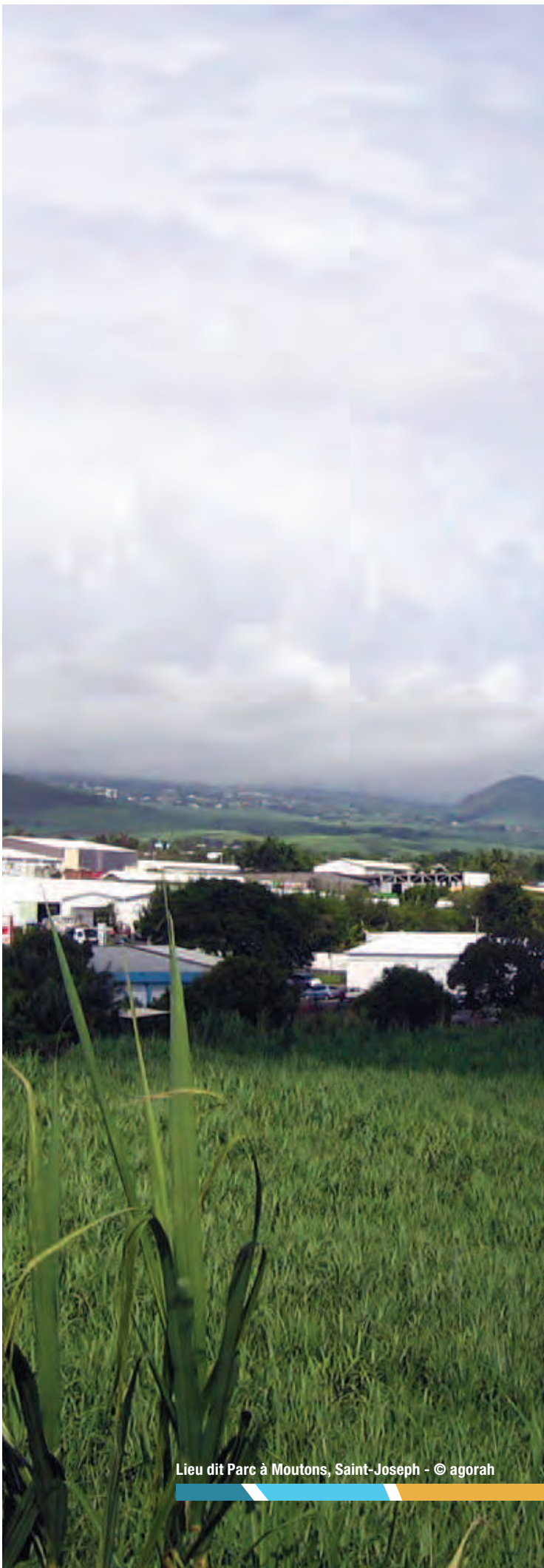
Lieu dit Parc à Moutons, Saint-Joseph - © agorah