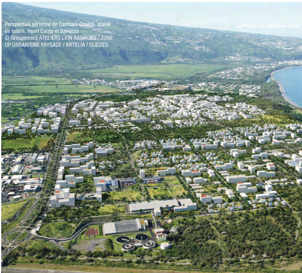
La Plaine de Cambaie dans le