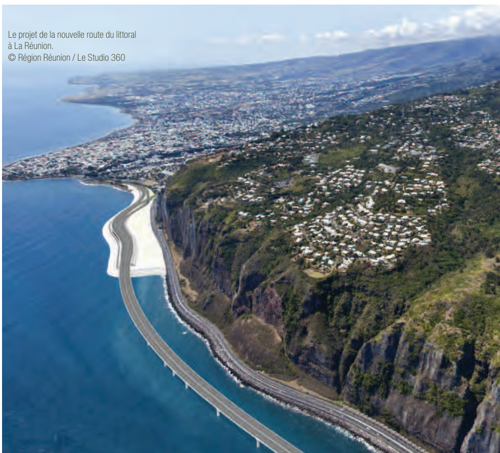
Le projet de la nouvelle route du littoral à La Réunion.