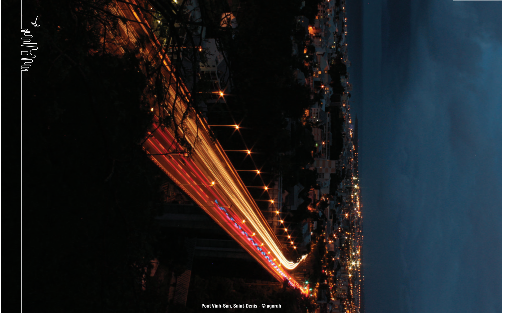
Pont Vinh-San, Saint-Denis