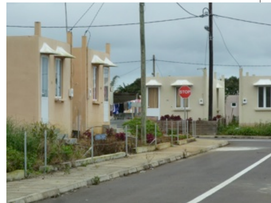
Ground Scale : Firinga u