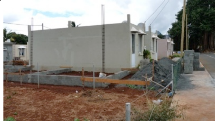
Firinga units (Model Firinga 5 detached - with future add