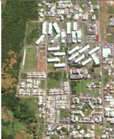
Camp le Vieux - Aerial view Cité NHDC