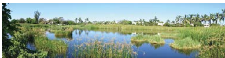
Etang Salé les Bains