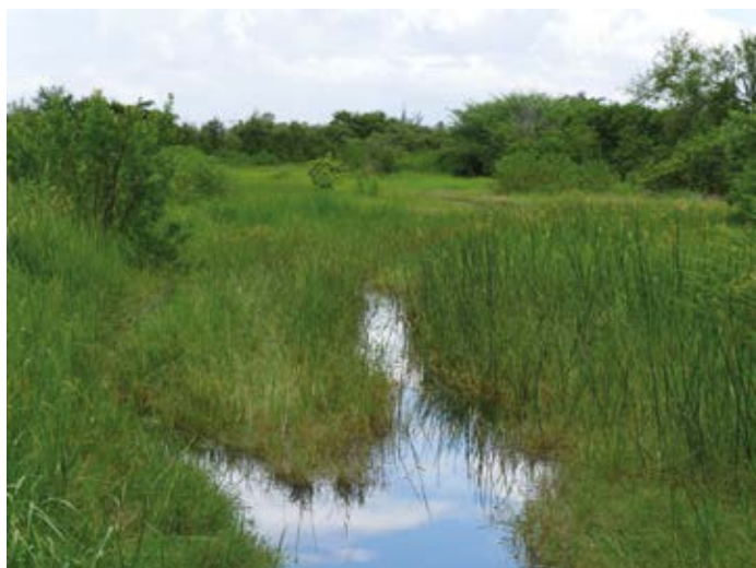
Prairie humide - Saint-Paul