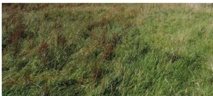
La Grande Ferme - Plaine des Cafres