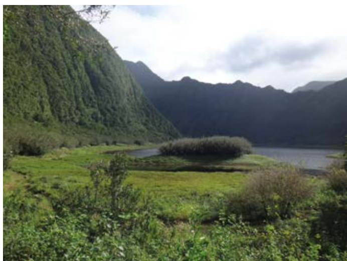
Grand Etang - Saint-Benoît