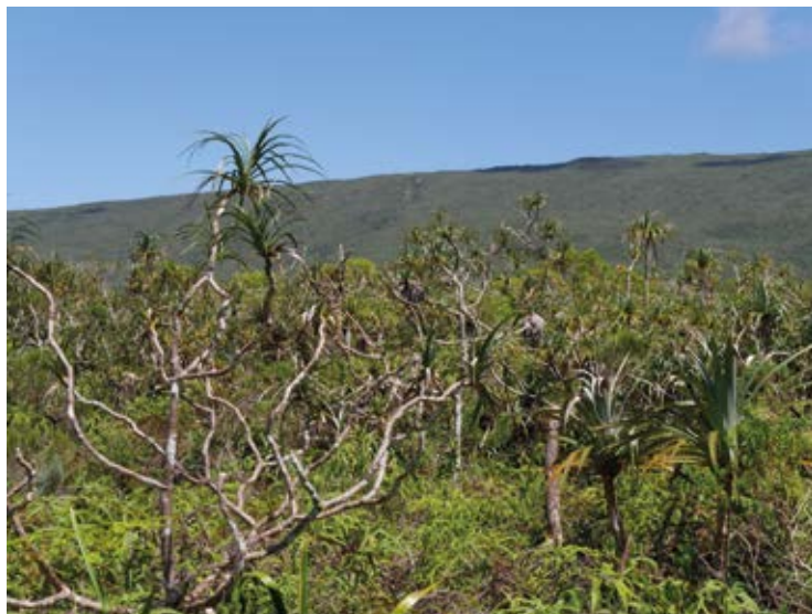
Pandanaie - La Plaine des Palmistes