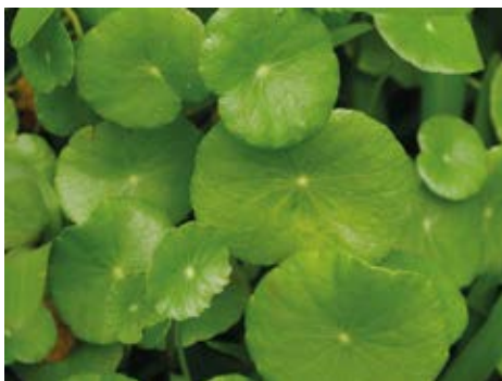
Herbe tam tam