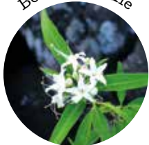
Bois de chenille