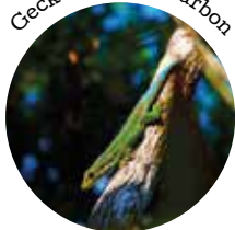
Gecko vert de Bourbon