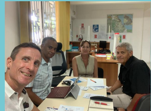
Rencontre avec la commune de Saint-Benoit