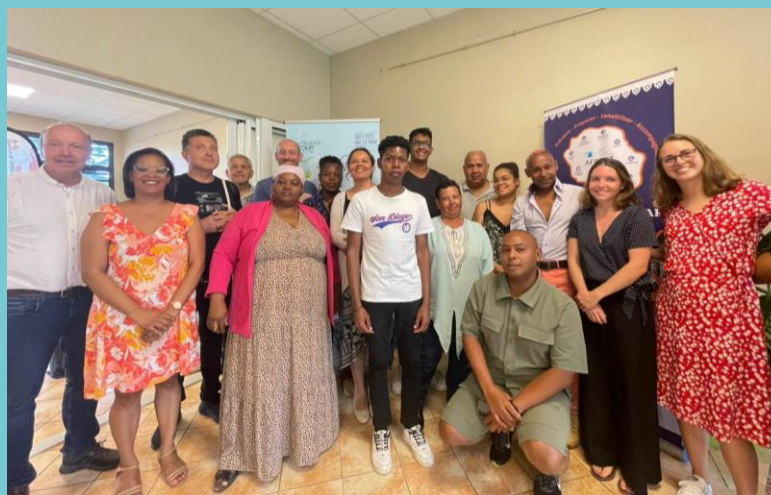
Premier atelier interassociatif – Saint-Benoit