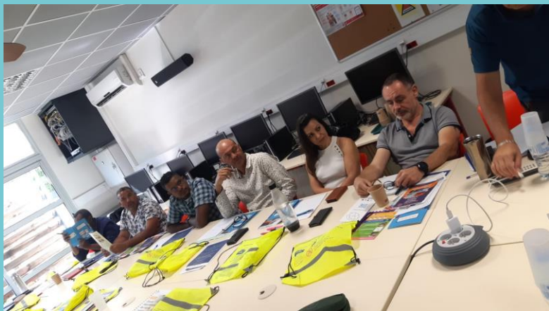
Atelier référents Risques et Ecole