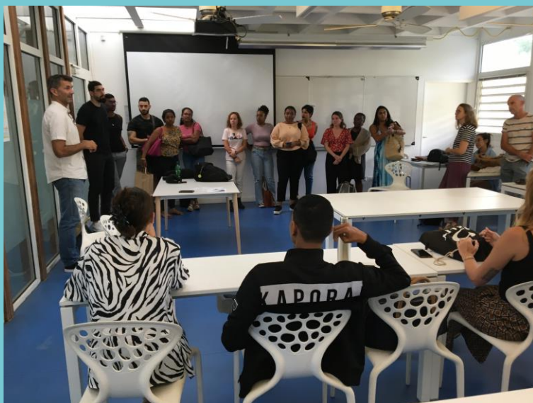
Rencontre avec le Master Risques et Environnement – Le Tampon