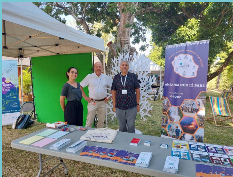
Stand lors des ARRN