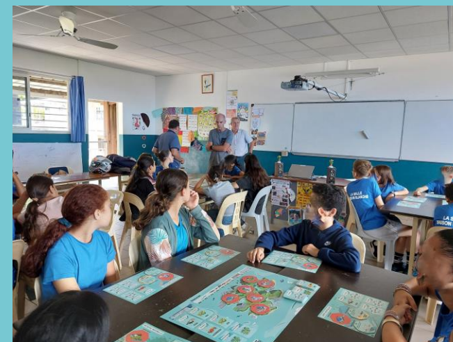
Expérimentation du jeu Ouragame au collège Maison Blanche