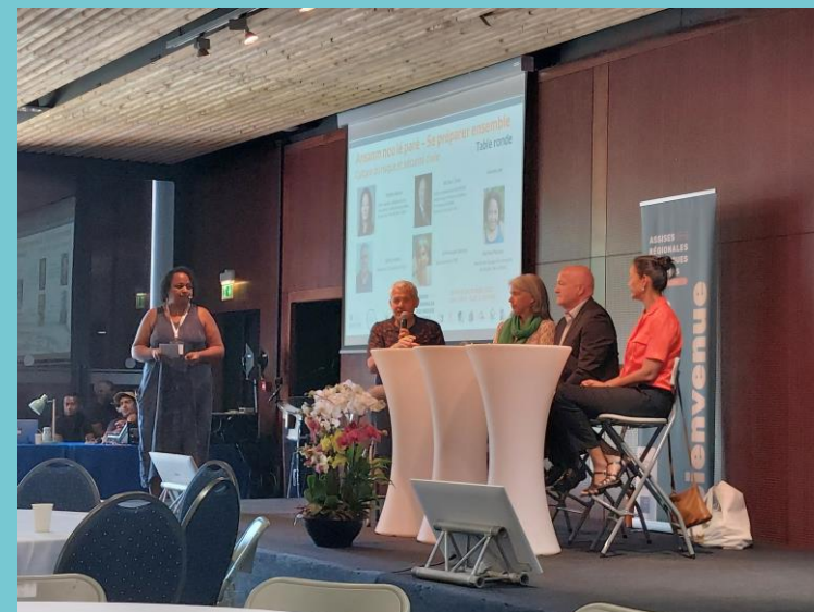
Table ronde Ansanm Nou Lé Paré