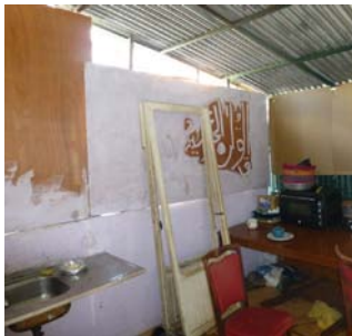
Absence de coin cuisine