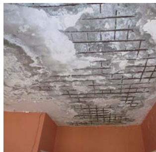
Dalle de plafond fragilisée et décrochements de morceaux de béton