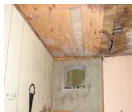
Infiltrations d'eau et absence d'aération