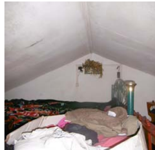
Hauteur sous plafond insuffisante (<2m20)