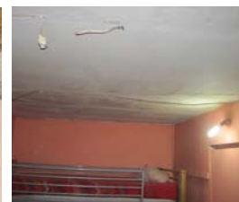
Chambre sans ouvrant sur l'extérieur