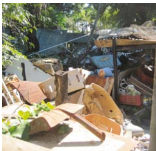
Entassement de déchets en tous genres