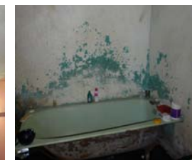
Salle de bain sommairement aménagée