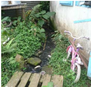
Évacuation des eaux usées à même le sol