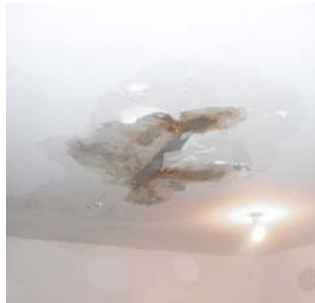
Infiltration importante mais localisée