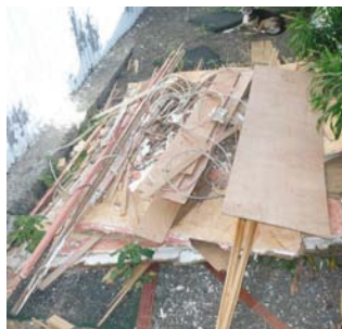
Déchets de chantier