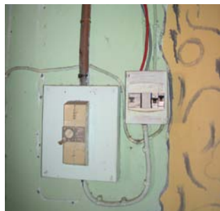
Installation non sécurisée