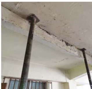
Immeuble «stabilisé» avec des étais