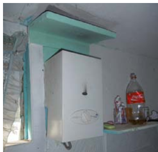
Chauffe-eau à gaz sans conduit d'évacuation, installé dans une salle de bain