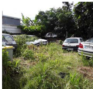
Présence de véhicules hors d'usage