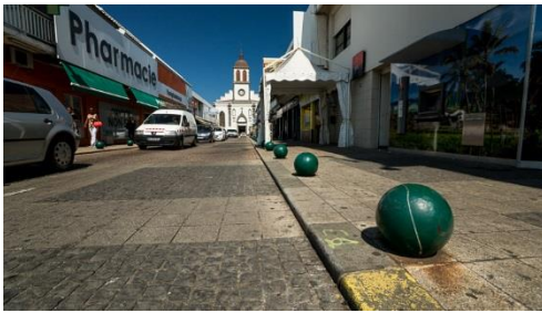
ZAC RHI centre ville, Saint Louis