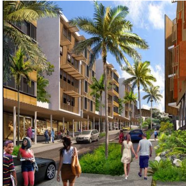
ZAC du soleil levant (Mayotte)

UTILISER LA NATURE COMME LEVIER DE REVITALISATION DES CENTRES URBAINS