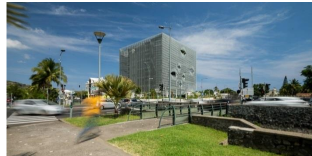
PRU du centre ville de Saint Paul