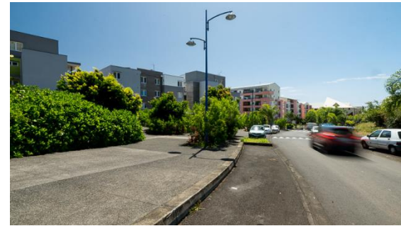
ZAC de la Madeleine, Saint Benoit