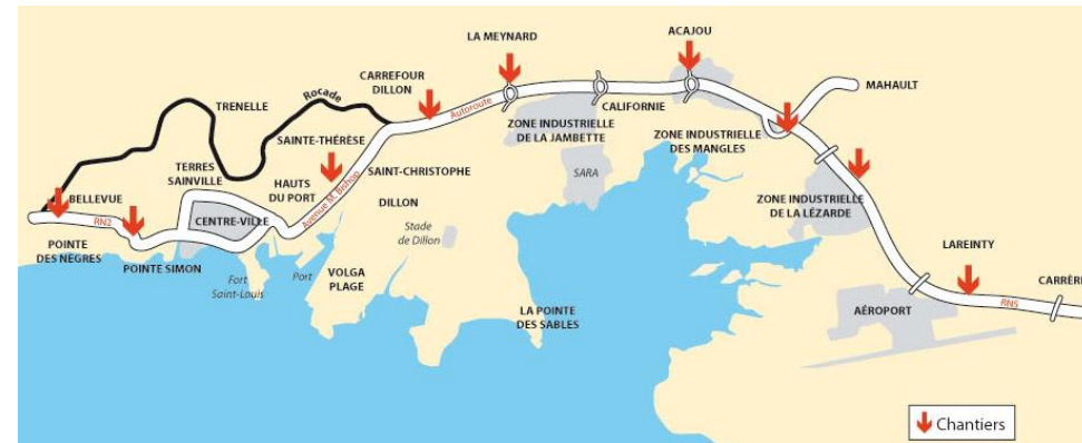
TCS de la Martinique, axe Lamentin/Fort de France (14km)