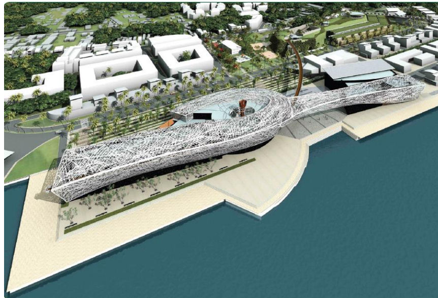
Memorial ACTe, Pointe à Pitre (Guadeloupe)

Renforcer l'attractivité des centres bourgs par des espaces publics de qualité