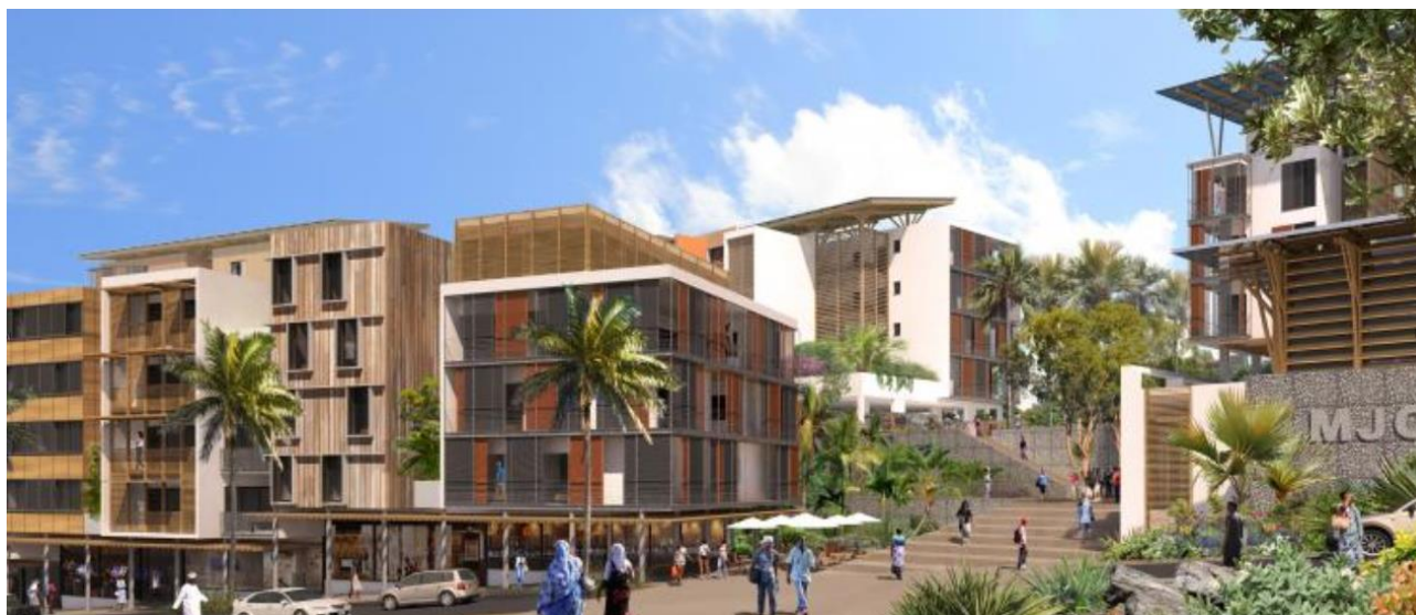
ZAC du soleil levant (Mayotte)

UTILISER LES LEVIERS DE L'URBANISME COMME SUPPORT D'INTÉGRATION SOCIALE