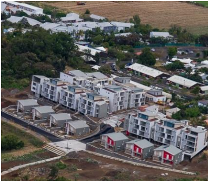
ZAC La Saline