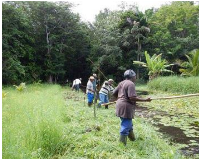
La source de Saint-Sauveur à Morne-à-l'Eau (Guadeloupe)

S'APPUYER SUR LE CAPITAL SOCIAL EXISTANT DANS LES QUARTIERS D'HABITAT INFORMEL