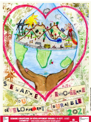
Ecole de Roche Plate-Mafate