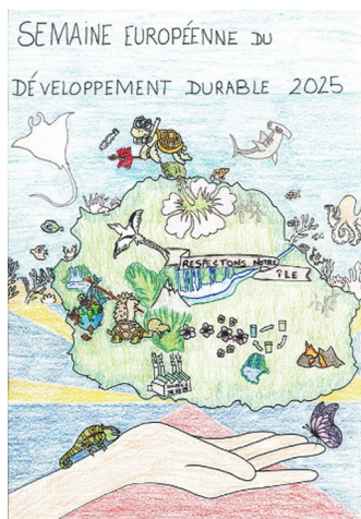
Ecole élémentaire Paul Eluard à Saint-Louis