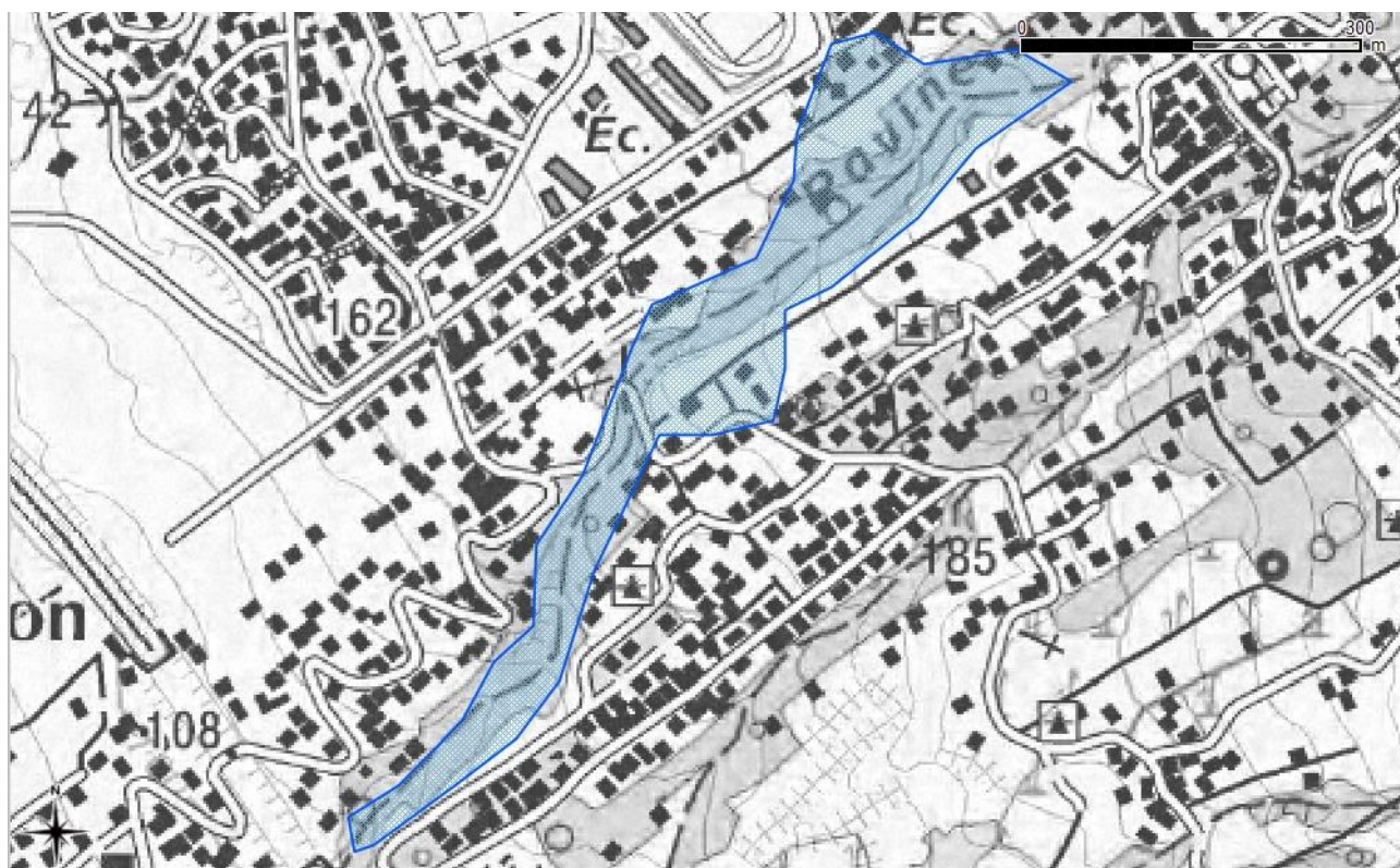
Carte 2: Délimitation de la ZNIEFF

Habitats présentant un état de conservation dégradé (100 %).