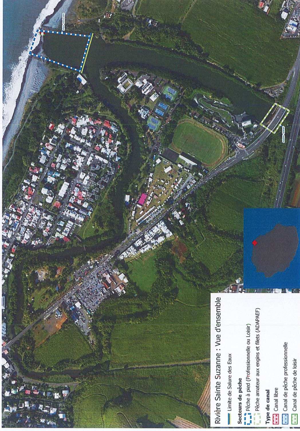
Figure 1 : Vue d'ensemble de la localisation du projet de l'APBSS sur l'embouchure de la rivière Sainte-Suzanne.