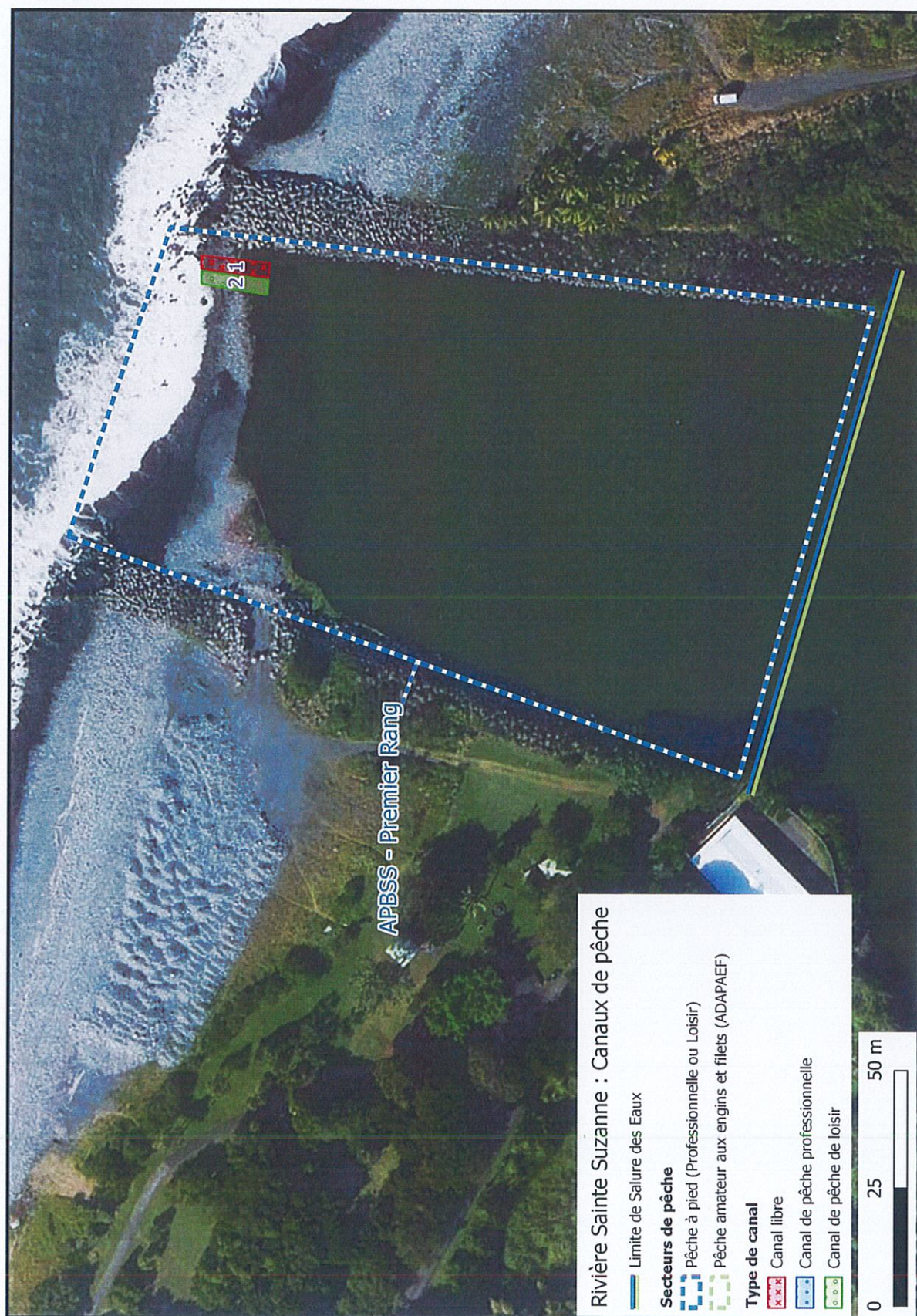
Figure 2 : Vue de principe des canaux de pêche aux bichiques sollicités par l'APBSS sur la rivière Sainte-Suzanne. La position est variable selon la disposition des alluvions à la fin de la période cyclonique et selon l'action d'entretien menée par la CINOR.