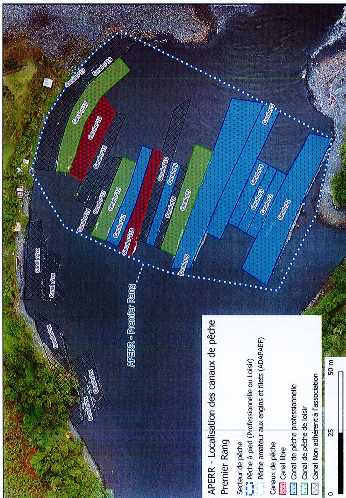
Figure 2 : APERR - disposition canaux rang 1