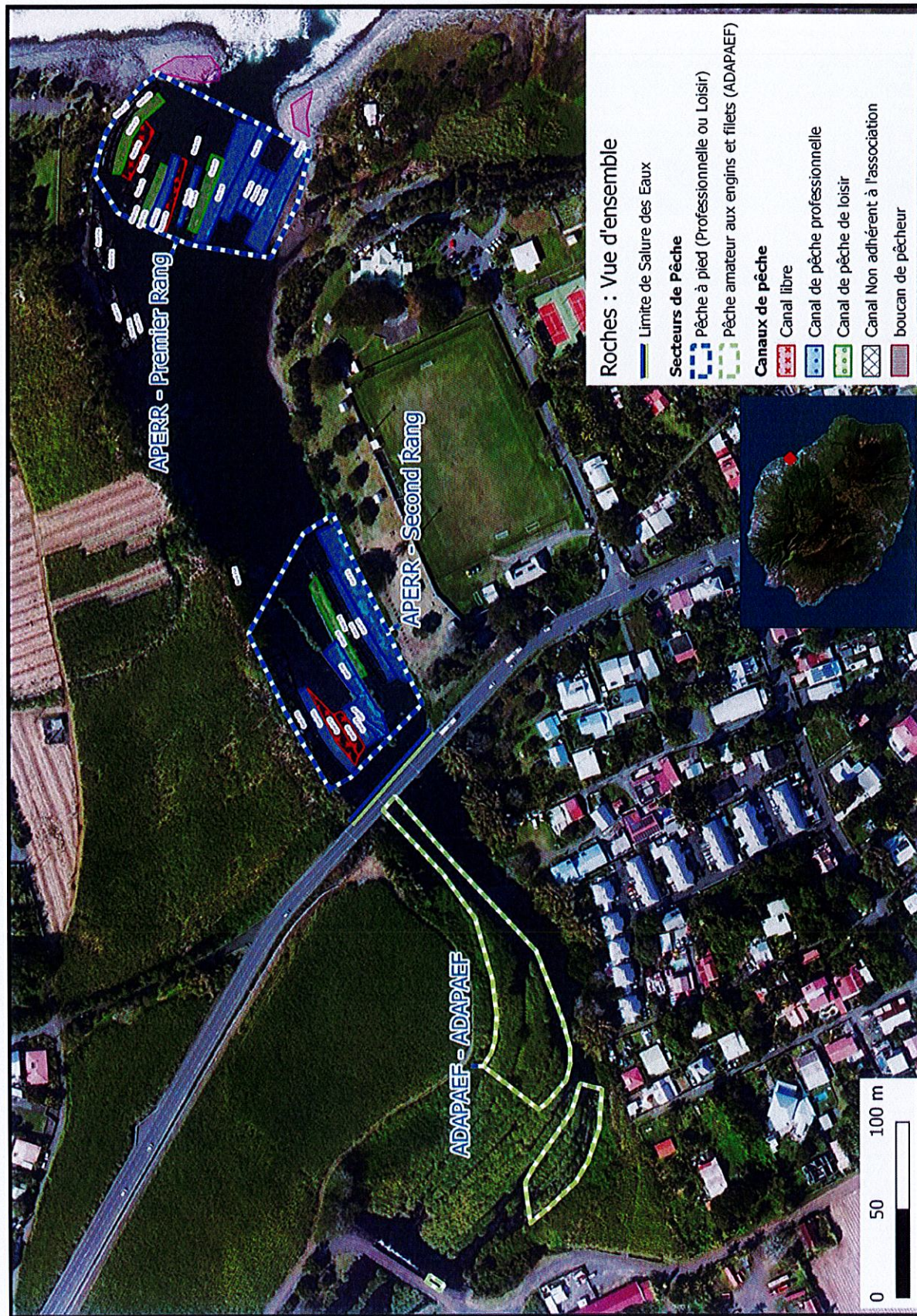
Figure 1 : APERR - vue d'ensemble